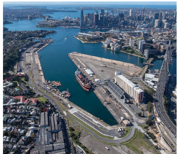
Bays west 地区