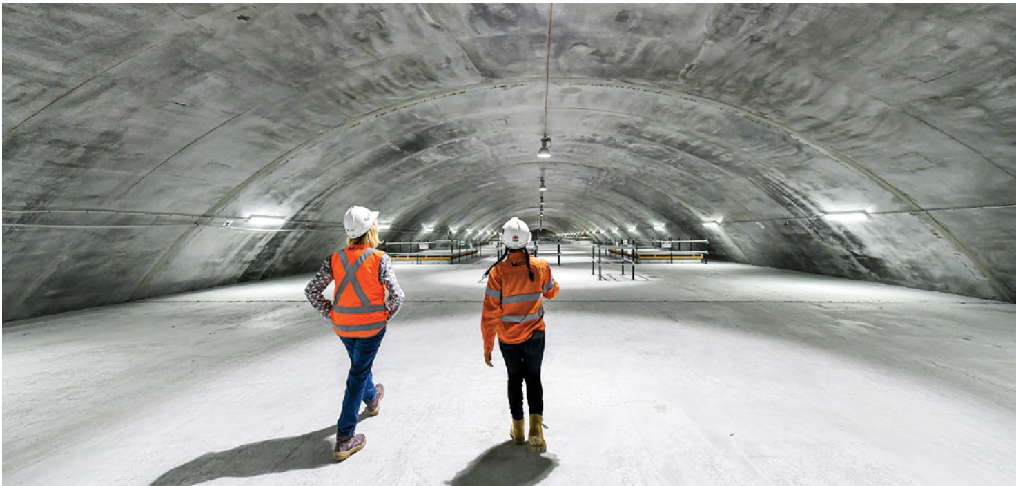
Sydney Metro City & Southwest 项目的洞库

隧道工程将须启用两台隧道掘进机挖掘从The Bays 到 Hunter Street之间的隧道。隧道掘进机均将在The Bays 启用, 会在Johnstons Bay 和 Darling Harbour 海港下面挖掘出双隧道, 然后抵达Hunter Street. The Sydney Metro West 隧道平均深度将是38米: 大约地下13层楼深。