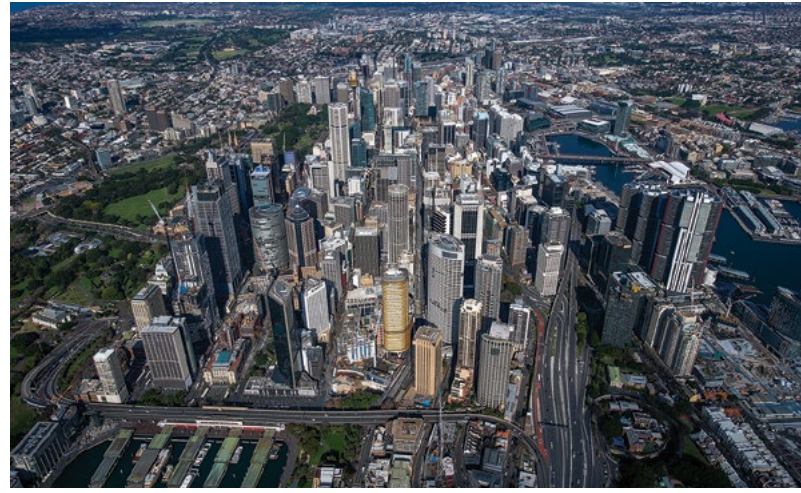
Sydney CBD 鸟瞰图

拟建的地下人行道将使得地铁站可以高效连接到Sydney Metro市中心和西南地铁线及悉尼火车系统，让从Martin Place 一直到Barangaroo之间的交通都很便捷。在早上高峰时段，新车站预计将拥有整个悉尼铁路网中最多的城市客流量，为Wynyard和Town Hall站减轻压力。