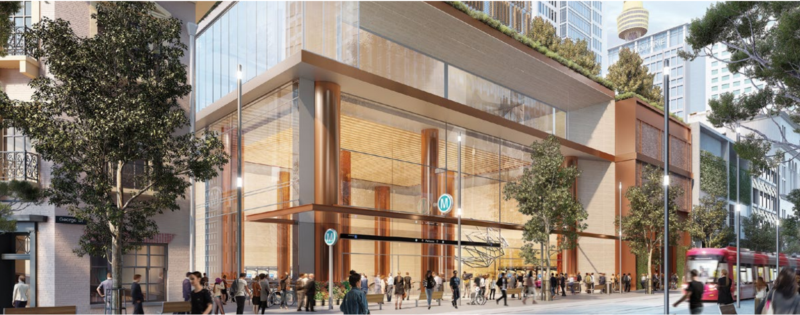
Hunter Street 站效果图