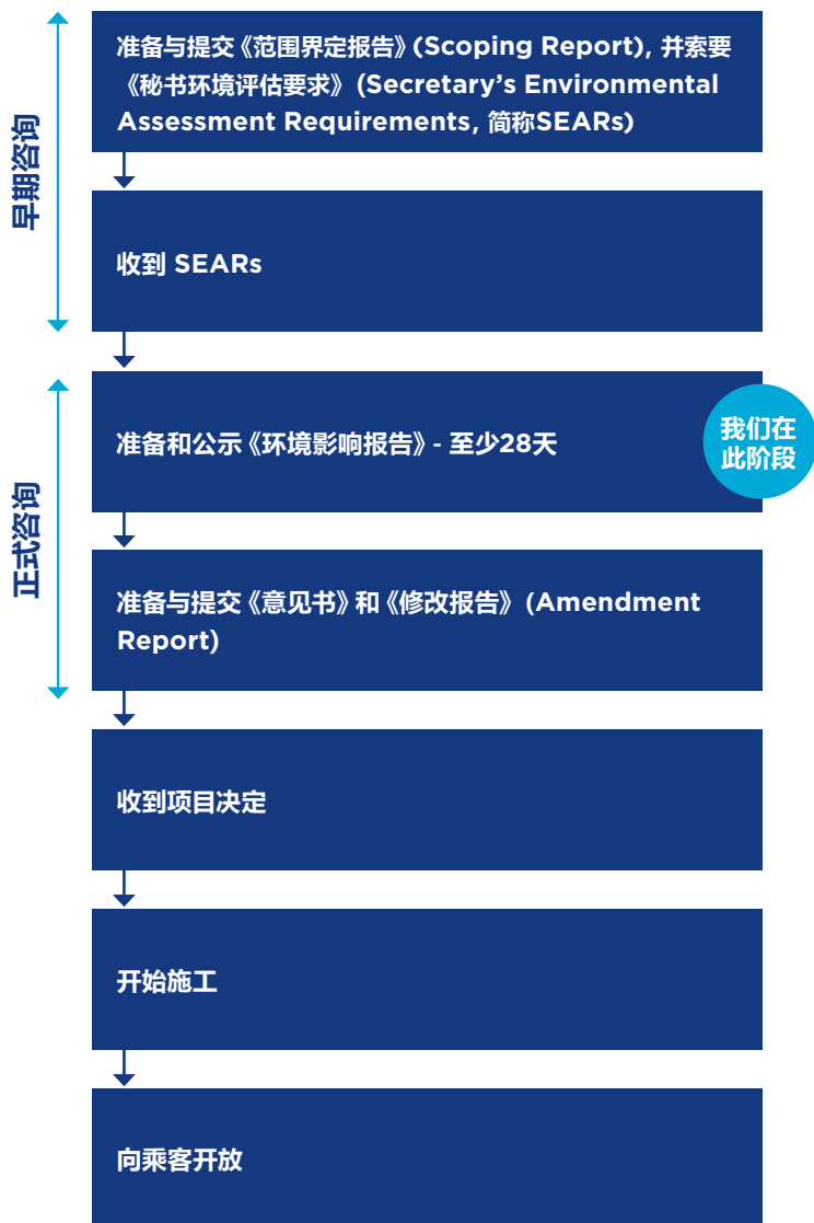
Sydney Metro West 虚拟参与室